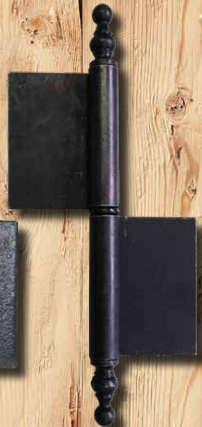
Y 310 E GH 235 mm LH 80 mm Ø = 18 mm ST = 2,5 mm Eisen € 17,50 Messing € 28,40