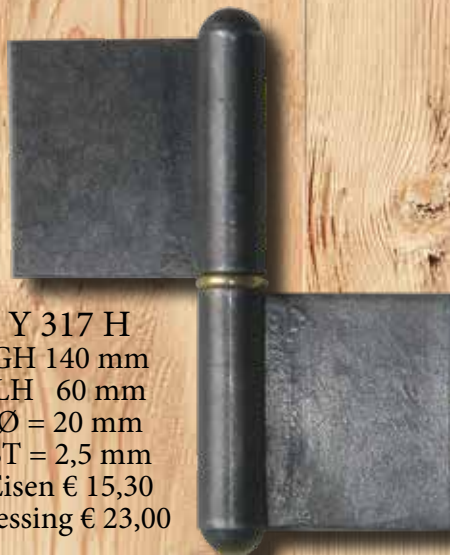
Y 317 H GH 140 mm LH 60 mm Ø = 20 mm ST = 2,5 mm Eisen € 15,30 Messing € 23,00