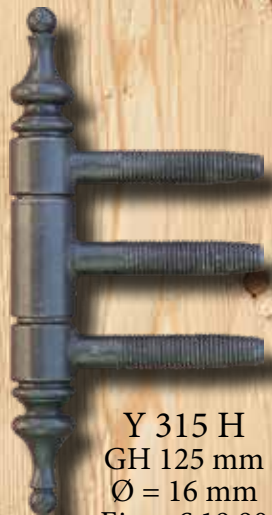
Y 315 H GH 125 mm Ø = 16 mm Eisen € 19,90 Messing € 28,30