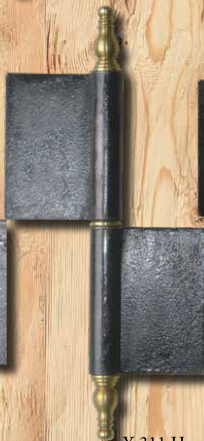
Y 311 H GH 235 mm LH 80 mm Ø = 18 mm ST = 2,5 mm Eisen € 17,50 Messing € 28,40