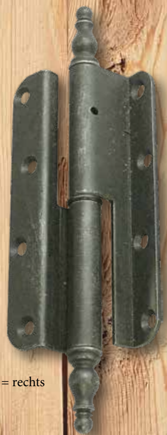
Abb. = rechts

Eisen- oder Messingzierköpfe rechts oder links Rolle : 15,5 mm Gesamthöhe : 220 mm Lappenhöhe : 140 mm Lappenlänge : 30 mm Stift : 10 mm € 35,75