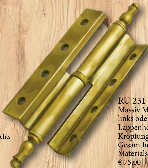
Abb. = rechts

Eisen- oder Messingzierköpfe links oder rechts Lappenhöhe 140 mm Kröpfung : KD 13 Gesamthöhe : 220 mm Materialstärke : 3 mm € 63,10