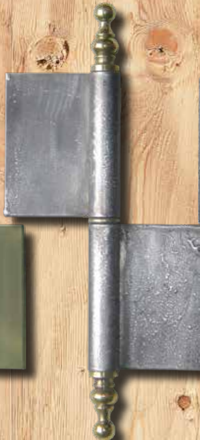
Y 310 H GH 235 mm LH 80 mm Ø = 18 mm ST = 2,5 mm Eisen € 17,50 Messing € 28,40