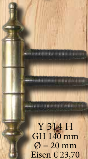
Y 314 H GH 140 mm Ø = 20 mm Eisen € 23,70 Messing € 31,90