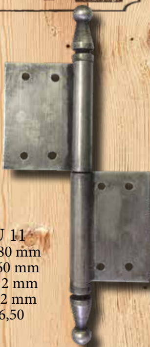
HU 11 GH 180 mm LH 60 mm Ø = 12 mm ST = 2 mm € 16,50