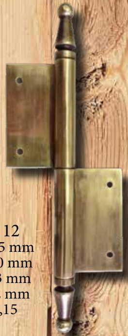
HU 12 GH 185 mm LH 60 mm Ø = 13 mm ST = 2 mm € 18,15