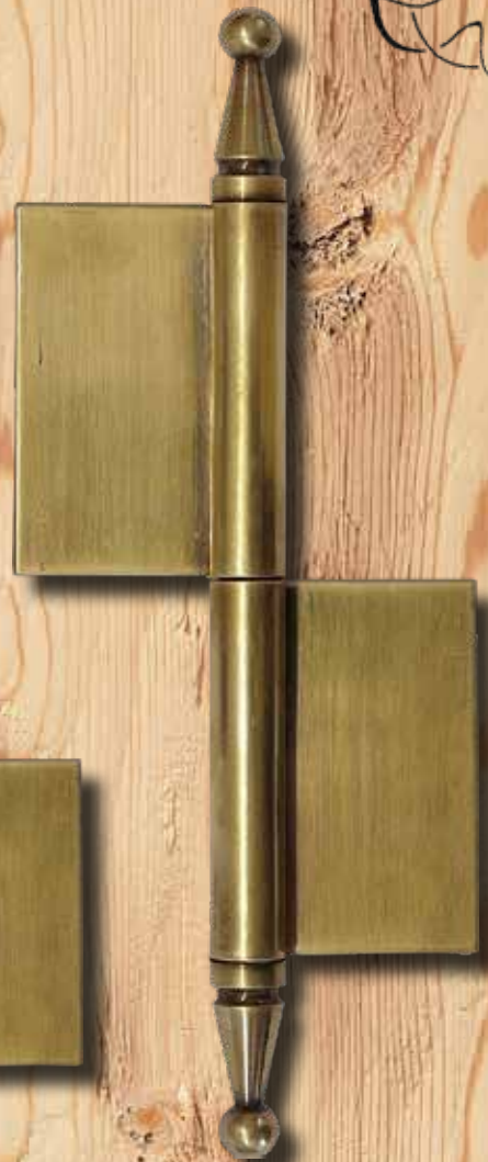
5368 M RE GH 235 mm LH 140 mm Ø = 17 mm ST = 2,5 mm € 41,45