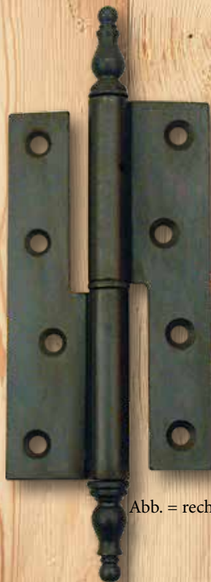
Abb. = rechts

Eisen- oder Messingzierköpfe rechts oder links Rolle : 15,5mm Gesamthöhe : 220 mm Lappenhöhe : 70 mm pro Lappen Lappenlänge : 54 mm Stift : 10 mm € 35,75