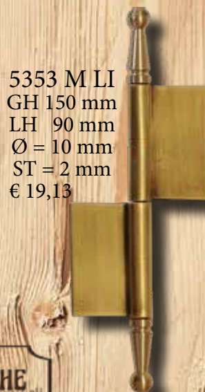
5353 M LI GH 150 mm LH 90 mm Ø = 10 mm ST = 2 mm € 19,13