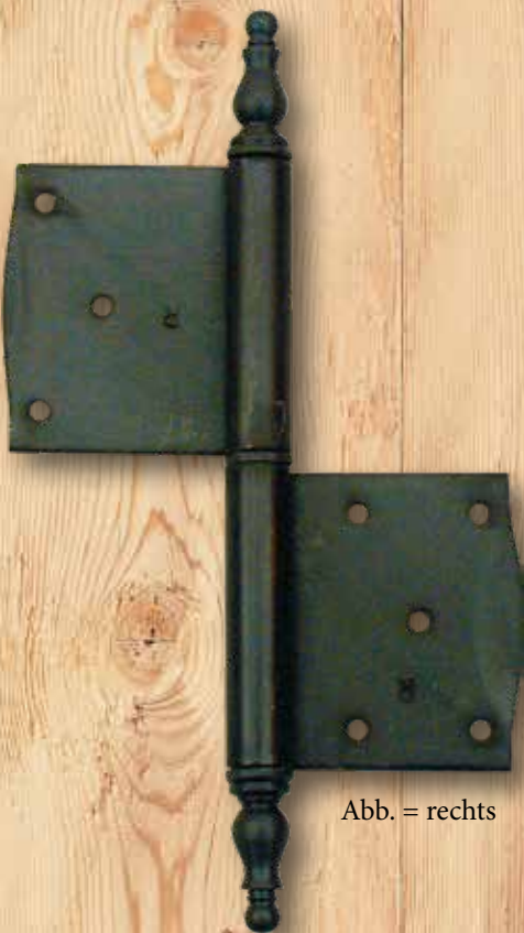
Abb. = rechts