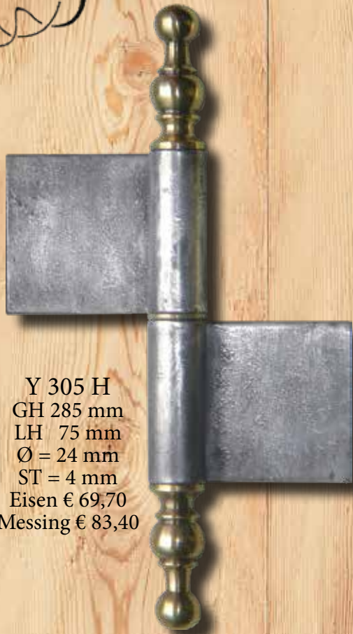
Y 305 H GH 285 mm LH 75 mm Ø = 24 mm ST = 4 mm Eisen € 69,70 Messing € 83,40