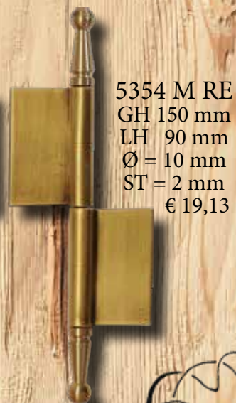
5354 M RE GH 150 mm LH 90 mm Ø = 10 mm ST = 2 mm € 19,13