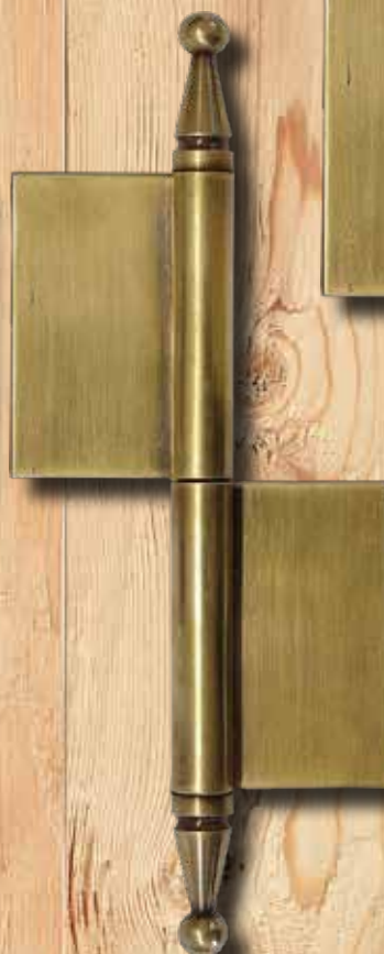
5358 M RE GH 180 mm LH 120 mm Ø = 12 mm ST = 2 mm € 26,55