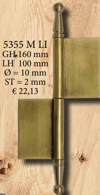
5355 M LI GH 160 mm LH 100 mm Ø = 10 mm ST = 2 mm € 22,13