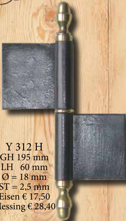
Y 312 H GH 195 mm LH 60 mm Ø = 18 mm ST = 2,5 mm Eisen € 17,50 Messing € 28,40