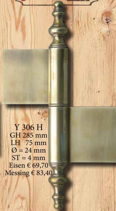
Y 306 H GH 285 mm LH 75 mm Ø = 24 mm ST = 4 mm Eisen € 69,70 Messing € 83,40