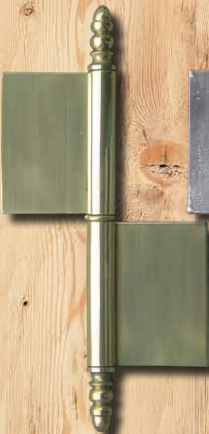
Y 309 H GH 235 mm LH 80 mm Ø = 18 mm ST = 3 mm Eisen € 17,50 Messing € 28,40