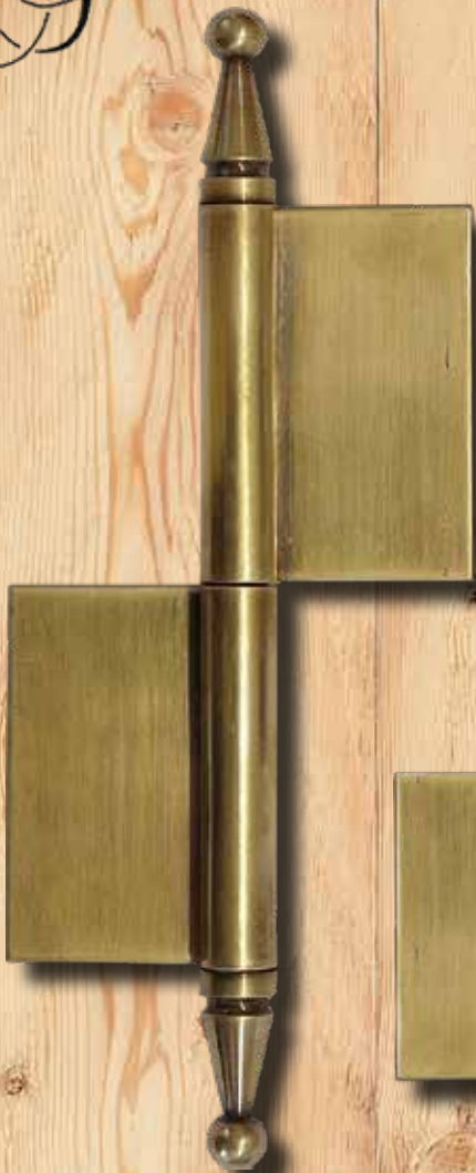
5367 M LI GH 235 mm LH 140 mm Ø = 17 mm ST = 2,5 mm € 41,45