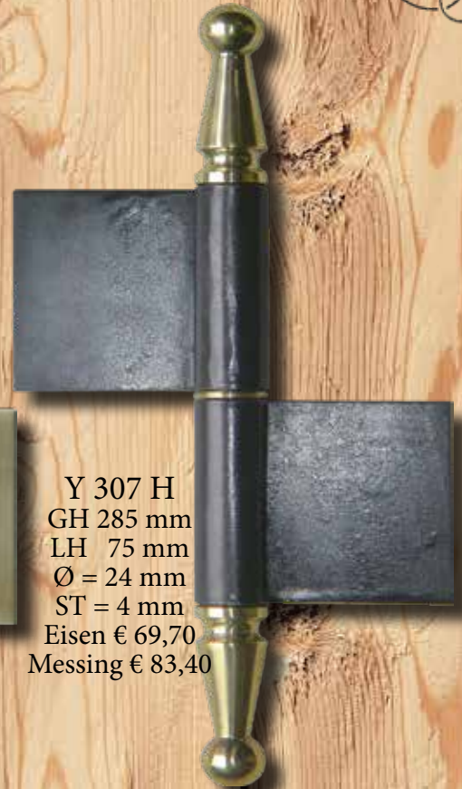
Y 307 H GH 285 mm LH 75 mm Ø = 24 mm ST = 4 mm Eisen € 69,70 Messing € 83,40