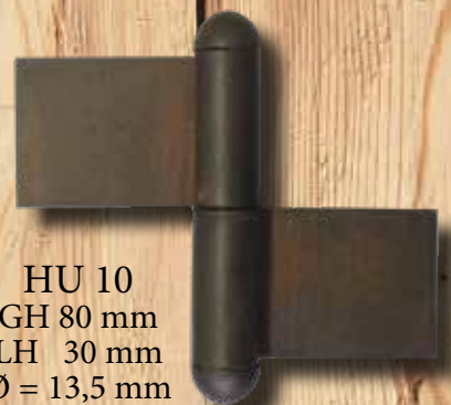
HU 10 GH 80 mm LH 30 mm Ø = 13,5 mm ST = 2 mm € 8,80