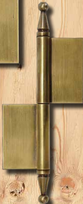
5357 M LI GH 180 mm LH 120 mm Ø = 12 mm ST = 2 mm € 26,55