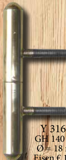
Y 316 H GH 140 mm Ø = 18 mm Eisen € 19,20 Messing € 25,50