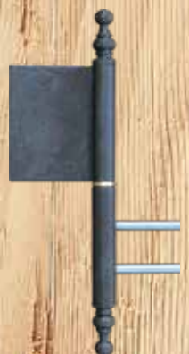
Sonderanfertigung Fitsche kombiniert mit Einbohrband für Bandtaschen